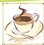
Café & Imbiss