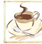
Café & Imbiss